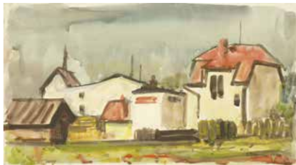
Ladislav Záborský, Pri mlyne, 1947, akvarel na kartóne, zo zbierok SNG

2. ÚLOHA: Reštaurovanie hrá dôležitú úlohu v ochrane výtvarných diel. Zahraj sa na reštaurátora a domaluj poškodené časti obrazu.